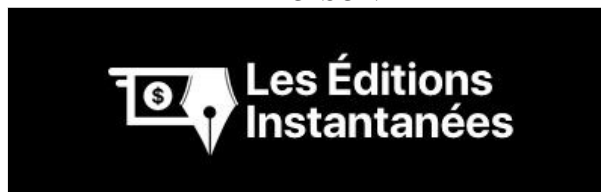
Illustration 1: Rendez-vous sur www.leseditionsi.com pour réaliser vos projets en utilisant l'art de la persuasion par les mots

Copyright © LES ÉDITIONS INSTANTANÉES - Matthieu DELOISON